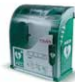
Omarica za defibrilator – AED

Vabimo vas na delavnico Temeljni postopki oživljanja s prikazom pravilne uporabe defibratorja, ki bo v ČETRTEK, 19. JANUARJA 2023, OB 18. URI V DVORANI MOL (Dom skupnosti), Belokranjska ulica 6 (Savsko naselje) .