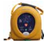
Defibrilator – AED