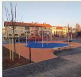
Osnovna šola Mirana Jarca