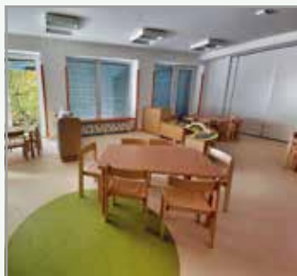
Vrtec Jelka, enota Palčki