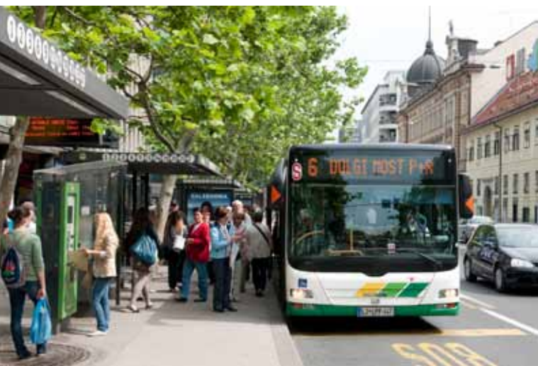
LPP SI PRIZADEVA ZA IZBOLJŠANJE VARNOSTI POTNIKOV.

Vodja ukrepa: Kmetijski inštitut Slovenije