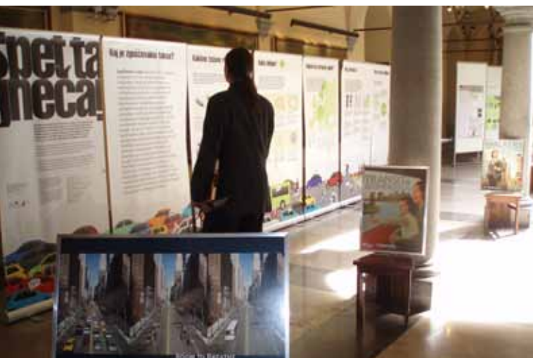
RAZSTAVA »SPET TA GNEČA!« OBRAVNAVA ZGOŠČEVALNO TAKSO.

Vodja ukrepa: Prometni institut Ljubljana