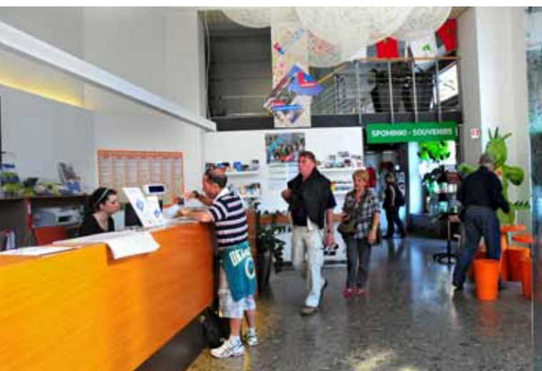
INFORMACIJE O TRAJNOSTNEM GIBANJU PO LJUBLJANI SO NA VOLJO V MOB-I-LNICAH.