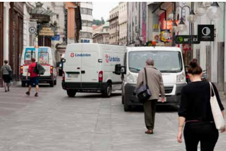
POSVEČALI SMO SE TRAJNOSTNEMU NAČRTOVANJU IN UREJANJU DOSTAVE BLAGA.