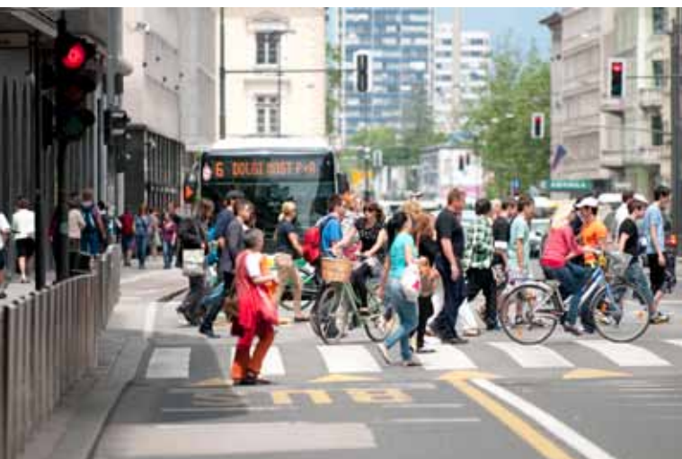
RUMENI PASOVI OMOGOČAJO HITREJŠI IN UČINKOVITEJŠI JAVNI PREVOZ.