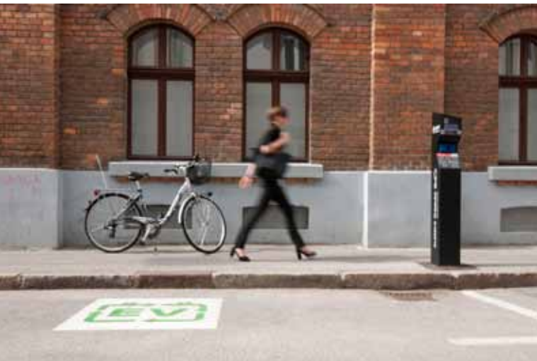
V LJUBLJANI JE TRENUTNO VEČ KOT 30 POLNILNIH POSTAJ ZA ELEKTRIČNA VOZILA.