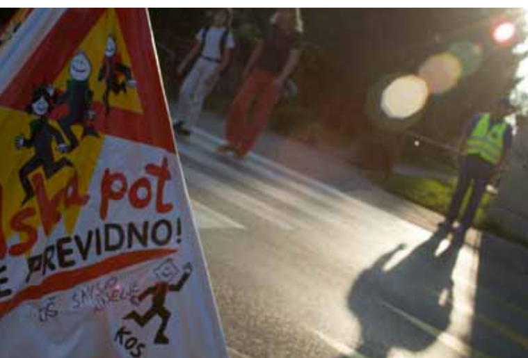
POTIV ŠOLO SO VARNEJŠE TUDI ZARADI CIVITAS ELANA.

Vodja ukrepa: Ljubljanski potniški promet