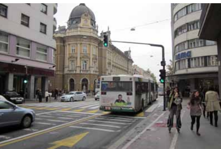
NOVI SISTEM DAJE »ZELENO LUČ« AVTOBUSOM ZNOTRAJ KORIDORJA.