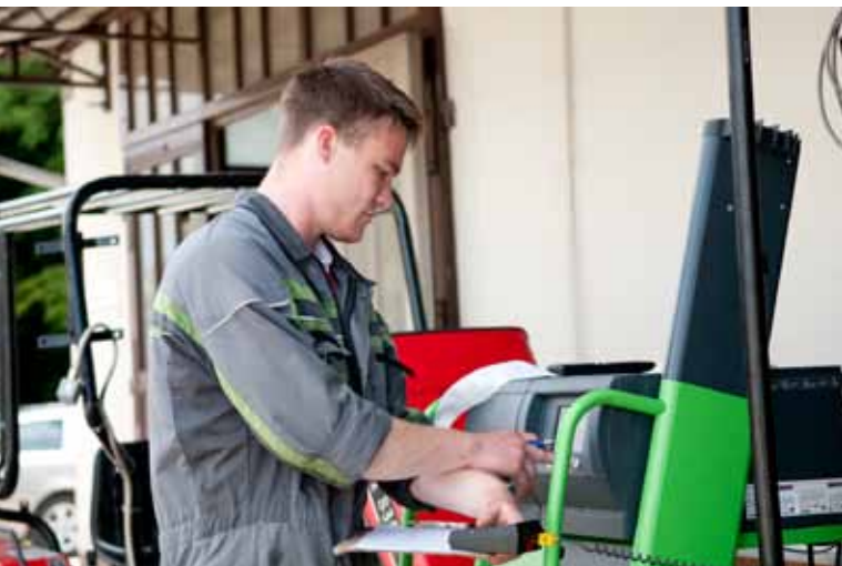
IZVAJALI SMO MERITVE NA VOZILIH S PREDELANIM MOTORJEM NA RASTLINSKO OLJE.