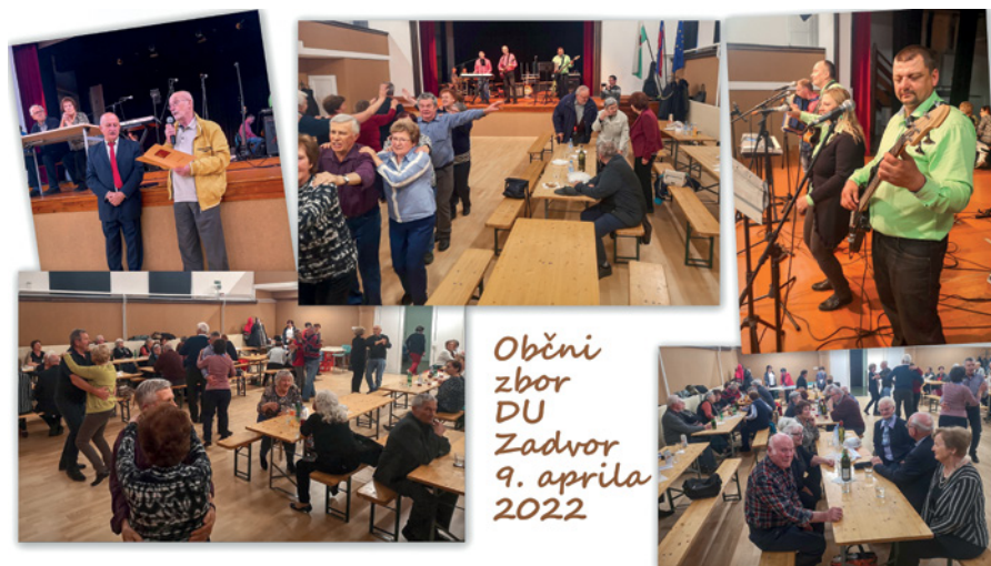
Občni zbor DU Zadvor 9. aprila 2022

Konec maja se bomo udeležili večdnevnega izleta v Srbijo »Šarganska osmica« (ta izlet je bil načrtovan v letu 2020, pa je bil zaradi izbruha koronavirusa-19 odpovedan). Kako bomo tam obujali spomine na