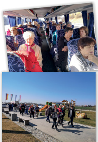
Ogled vzgoje orhidej in kopanje v termah Banovci 2. marca 2022

Slovenije. V začetku leta so naši poverjeniki obiskali preko 160 članov, starejših nad 80 let in jih skromno obdarili, sredstva je dodala Četrtna skupnost Sostro, članice »Društva žena in deklet« pa so prispevale ročno izdelane čestitke. Vse te dejavnosti nas povezujejo in krepijo naše vezi. Projekt »Starejši za starejše« uspešno deluje že 13. leto. Vsako leto večkrat obišejo preko 300 članov, vključenih v ta projekt.