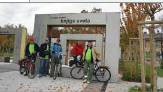
Start v Severnem parku

oblečene kolesarje. Pot nas je vodila skozi park proti železniški postaji, pri piramidi v Zupančičevi jami smo zavili na Vilharjevo cesto in se mimo Situle in tovarne Kolinska odpeljali na Žale. Ker je bil ravno čas obiska grobov, smo tudi mi prižgali svečko. Nadaljevali smo po robu novega parka ob Šmartinski, kjer smo morali paziti na pešce in številne tekače, saj je območje okoli Žal postala prava meka za rekreativne tekače. Prek nadvoza čez severno obvoznico smo vstopili v nov svet – kmetijsko območje. Kolesarili smo med kouruznimi polji, se na Poti ob Savi malo izgubili, a vseeno našli prehod do Save. Tu nas je presenetil pravi ranč. Lesene ograje, rezgetanje konjev, prava paša za oči. Nadaljevali smo ob Savi po ozki