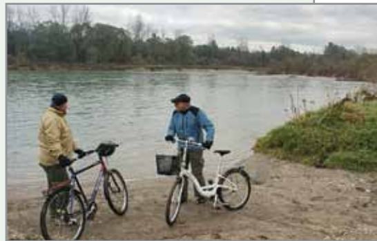
Pogled na Savo in otok

center, Smelt, športne objekte – dvorano in stadion Stožice, vaški ambient s kmečkimi poslopji in njivami, širši Sloveniji znane Ljubljanske mlekarn in Črno vdovo, stolpnico časopisne hiše Delo, in ne nazadnje divjino ob reki Savi s pravim pravcatim otokom. Še in še bi lahko naštevati, kaj vse se da videti za našim Bežigradom. Za zaključek pa še tole: središče Ljubljane je res izjemno privlačen cilj, a tudi naš Bežigrad ima veliko za pokazati. Zato namig: s kole-