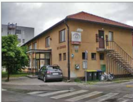
Defibrilator na Belokranjski ulici 6