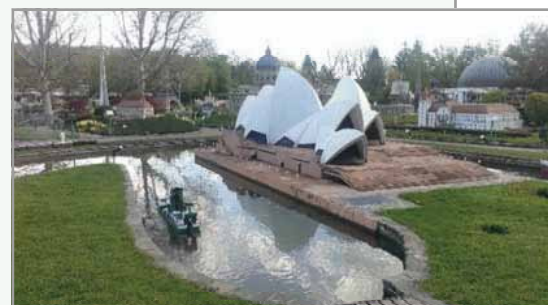
Opera v Sydneyju (1:25) – Minimundus

srečanje z učenci dvojezične trgovske akademije.