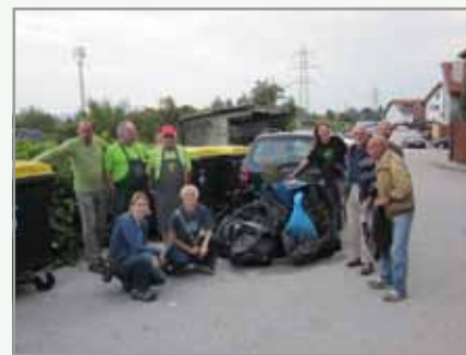
Nekaj utrinkov z letošnje akcije, ki je potekala v sredo, 3. septembra