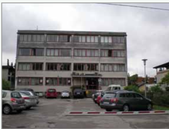
Defibrilator na Staničevi ulici 41